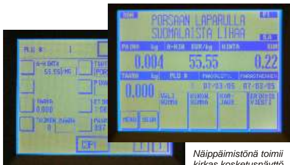
Näppäimistönä toimii kirkas kosketusnäyttö